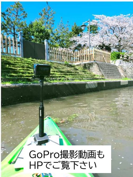
GoPro撮影動画もHPでご覧下さい